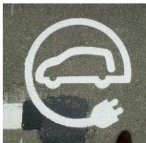
Señal en asfalto

3. Dentro de un radio de 100 metros del punto de recarga, y preferiblemente en vías principales, se instalarán señales de orientación que a través de flechas indiquen la cercanía y guíen hacia las plazas de estacionamiento público reservadas para la recarga de vehículos eléctricos. Esta señalización se complementará con aplicaciones informáticas de guiado y reserva de plazas para recarga.